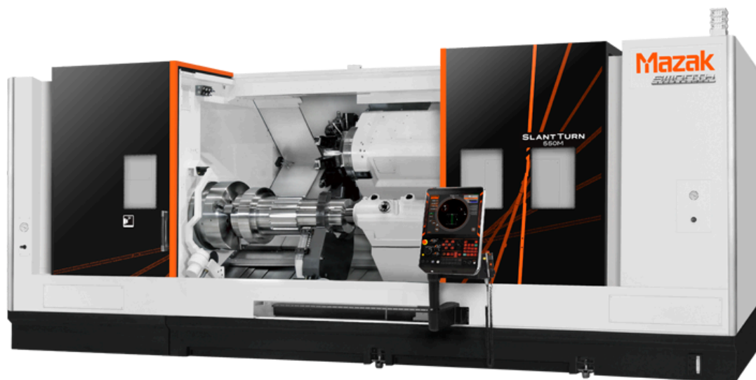
MAZAK Slant Turn 500M - 3000 Tour 3 axes Courses X/Z : 465 x 3300 mm Diamètre d'usinage max : Ø1040 mm Longueur d'usinage max : 3300 mm