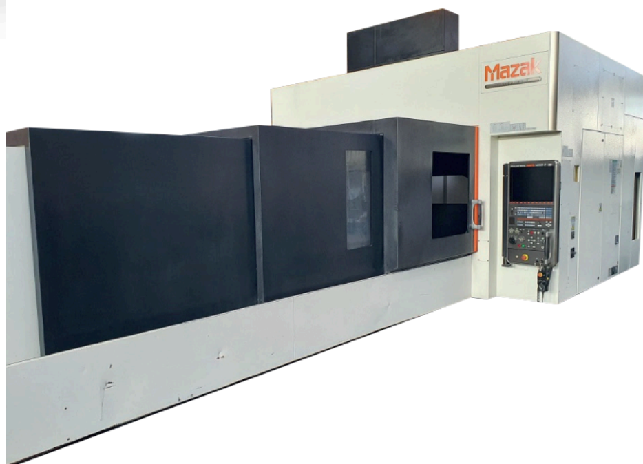
MAZAK FJV 60/160 Centre vertical Courses X/Y/Z : 4200 x 1400 x 660 mm Dimension table : 4000 x 1260 mm Vitesse de broche : 18 000 tr/min